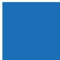
L / Bleu