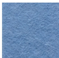
FLB / Bleu