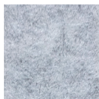
FGR / Gris argent