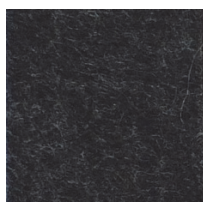
FCH / Charcoal

Référez-vous aux pages 21 - 22 de la nouvelle liste de prix C.I.T.É. pour les écrans disponibles avec ce nouveau matériau. Des échantillons des quatre (4) couleurs seront disponibles dans les prochaines semaines - nous vous aviserons dès qu'ils seront disponibles.