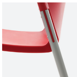
Pattes en métal