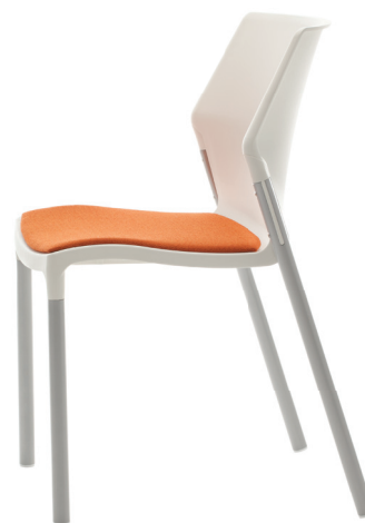
IO33 - Blanc & Messenger MG071 Satsuma