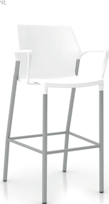
IO32H - Blanc