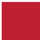
IS06 - Rouge